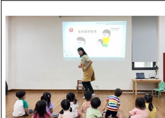
說明：演示拒絕方法