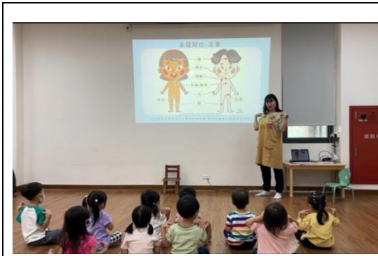
說明：複習身體部位名稱與位置