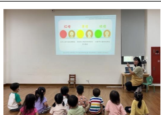
說明：複習身體紅綠燈內容