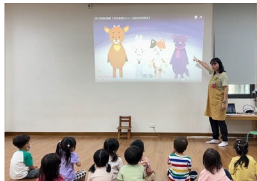
說明：解說影片內容