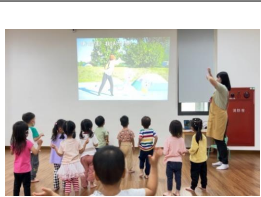
說明：齊跳做自己身體主人主題曲舞蹈