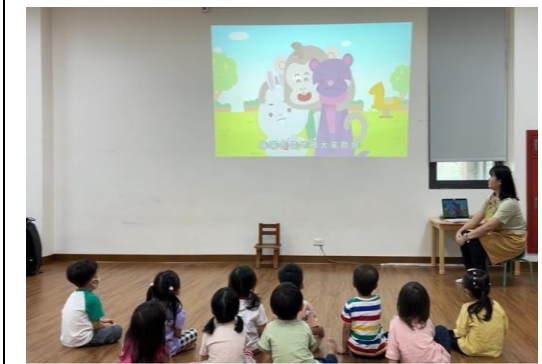
說明：觀看情境影片